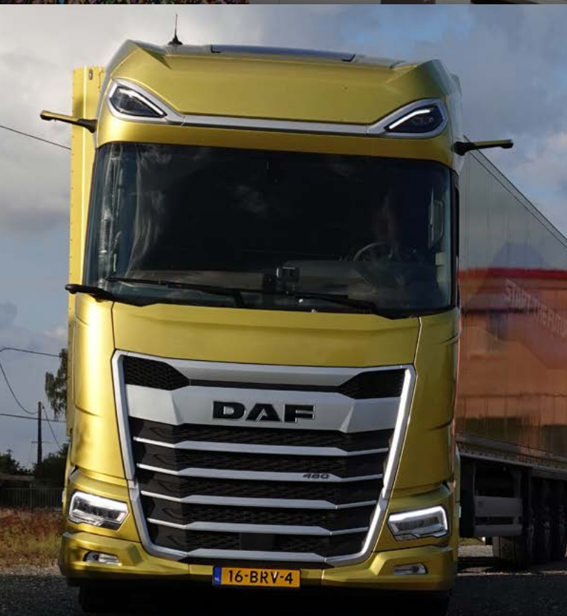
Zaparkováno vedle nedávno uzavřené restaurace Relais na státní silnici Route Nationale