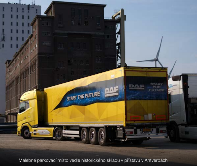
Malebné parkovací miesto vedle historického skladu v prístavu v Antverpách