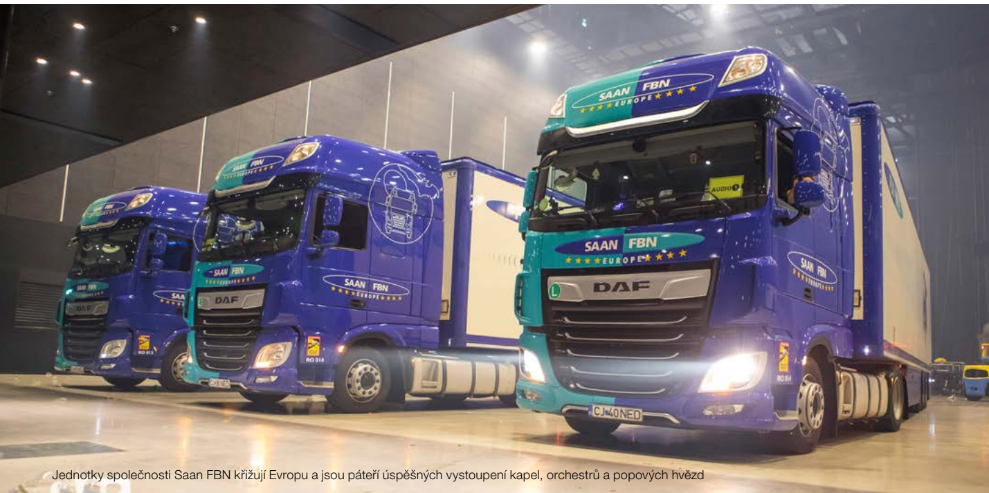
Jednotky společnosti Saan FBN křížují Evropu a jsou páteří úspěšných vystoupení kapel, orchestrů a popových hvězd