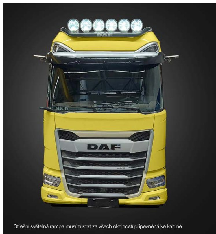
Střešní světelná rampa musí zůstat za všech okolností připevněná ke kabině

Ředitel designu společnosti DAF, Bart van Lotringen, vysvětluje celý proces: „Vzhled, který dáváme našim novým vozidlům, lze shrnout jedním slovem: „Prémiový“. Totéž platí samozřejmě i pro příslušenství DAF, které může majitel nebo řidič doplnit a ještě více si přizpůsobit své vozidlo. Vozidlo je důležitou vizitkou pro mnoho