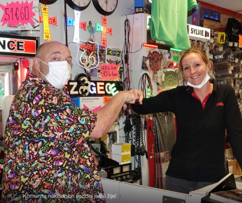
Komunita nákladních vozidel ještě žije!