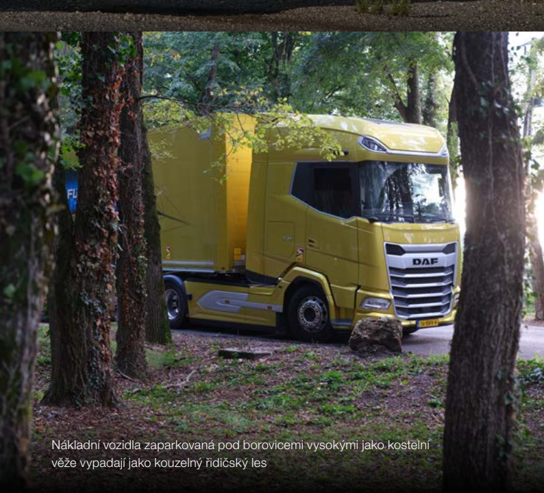
Nákladní vozidla zaparkovaná pod borovicemi vysokými jako kostelní věže vypadají jako kouzelný řídicí les